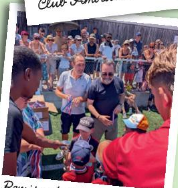
Remise récompenses foot Catégorie U6 U7 et U8