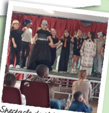
Spectacle de théâtre 1