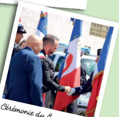
Cérémonie du 8 mai 1945