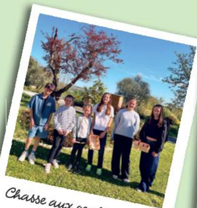
Chasse aux oeufs