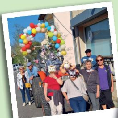
Carnaval Club Ambiance