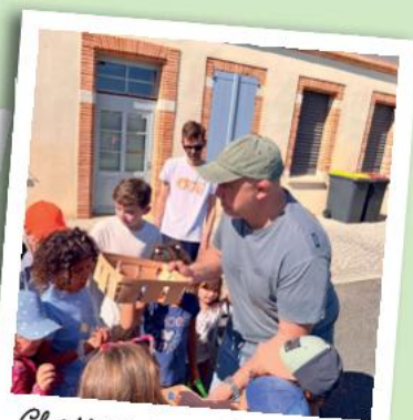
Chasse aux oeufs