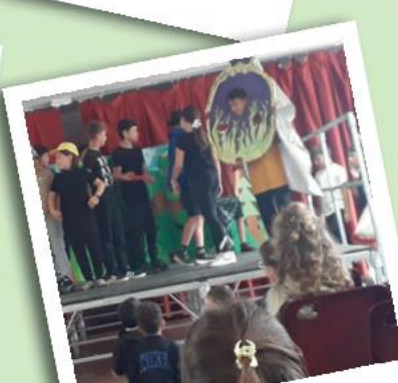
Spectacle de théâtre 2