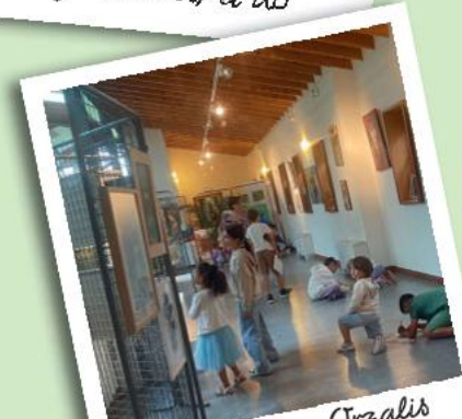
Visite exposition Orzalis